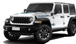
Bright White (valkoinen)