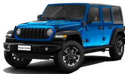
Hydro Blue (sininen)