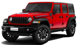
Firecracker Red (punainen)