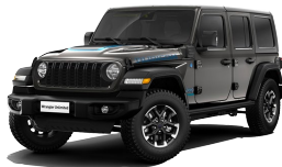
Granite Crystal (harmaa)