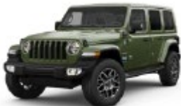
Sarge Green (vihreä)