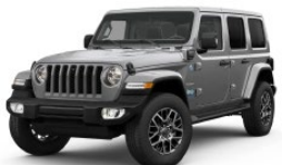
Sting Grey (harmaa)