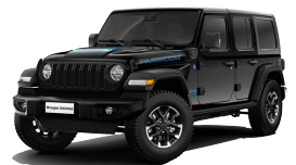
Clear Black (musta)